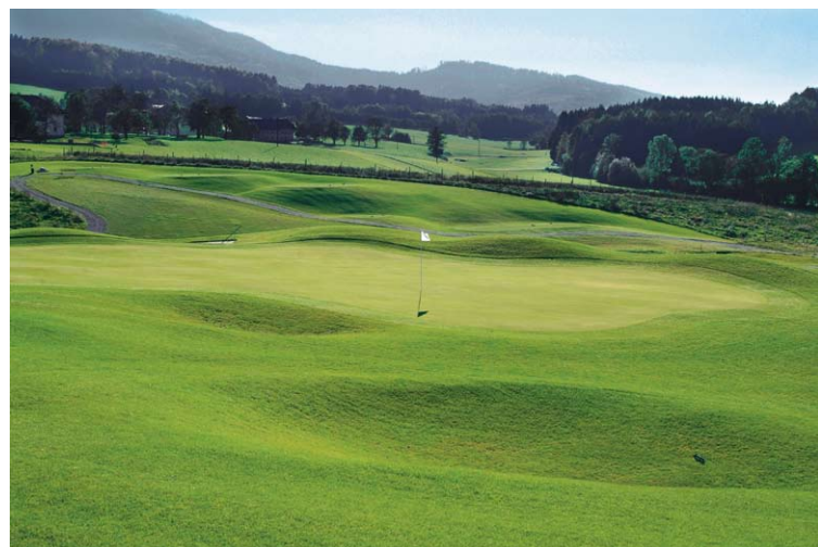
Der GC Attersee-Traunsee liegt genau zwischen den beiden Namensgebern, allerdings ohne Sicht auf dieselben. Dafür gibt es großzügige und großteils einprägsame Fairways voller Spannung und Charme, umrahmt von beruhigender Natur.