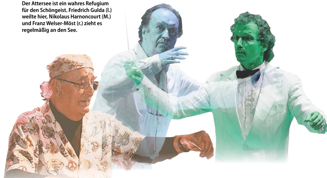
Der Attersee ist ein wahres Refugium für den Schöngeist. Friedrich Gulda (l.) weilte hier, Nikolaus Harnoncourt (M.) und Franz Welser-Möst (r.) zieht es regelmäßig an den See.

TOURISMUS-DEFIZIT? Was die einen am Attersee bemängeln, das Fehlen einer ausgeklügelten touristischen Infrastruktur – Top-Hotels, Freizeiteinrichtungen etc. –, stört das Gros der speziellen Gästeschar, die aktuell im Sommer den Attersee bevölkert, wenig: die Zweitwohnungsbesitzer aus Wien, Linz und München. Die Einheimischen sind vorwiegend nicht auf die Vermietung von Betten angewiesen, sondern genießen durch erfolgreiche Industriebetriebe in der