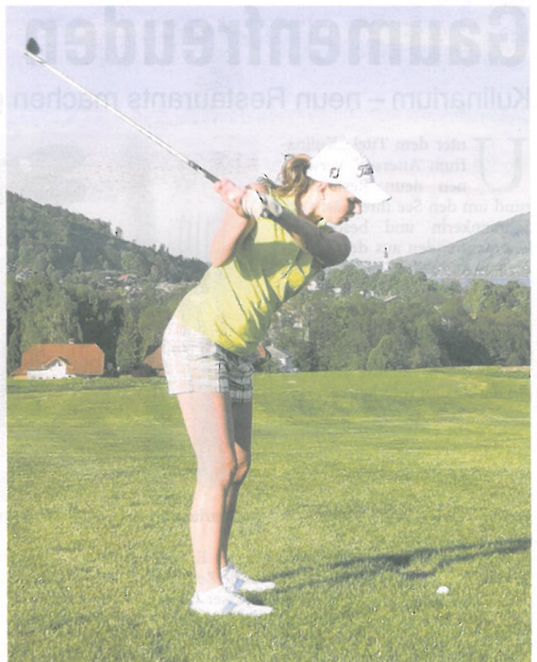
Im Golfclub Attersee beginnt der Spielbetrieb.

Nur wenige Kilometer vom Attersee entfernt befindet sich der 18-Loch-Platz des Golfclubs Attersee-Traunsee mit Sitz in der Gemeinde Regau. Der Turnierplatz mit 6392 Metern für Herren und 5610 Metern für Damen mit sechs Abschlägen pro Bahn umfasst eine Gesamtfläche von 83 Hektar in idyllischer Landschaft. Derzeit hat der GC Attersee-Traunsee ein besonders interessantes Angebot für Neueinsteiger parat: Um 998 Euro gibt's Platzreife, Schlägersatz und Spielrecht. Mehr Infos dazu gibt es unter www.atterseegolf.at .